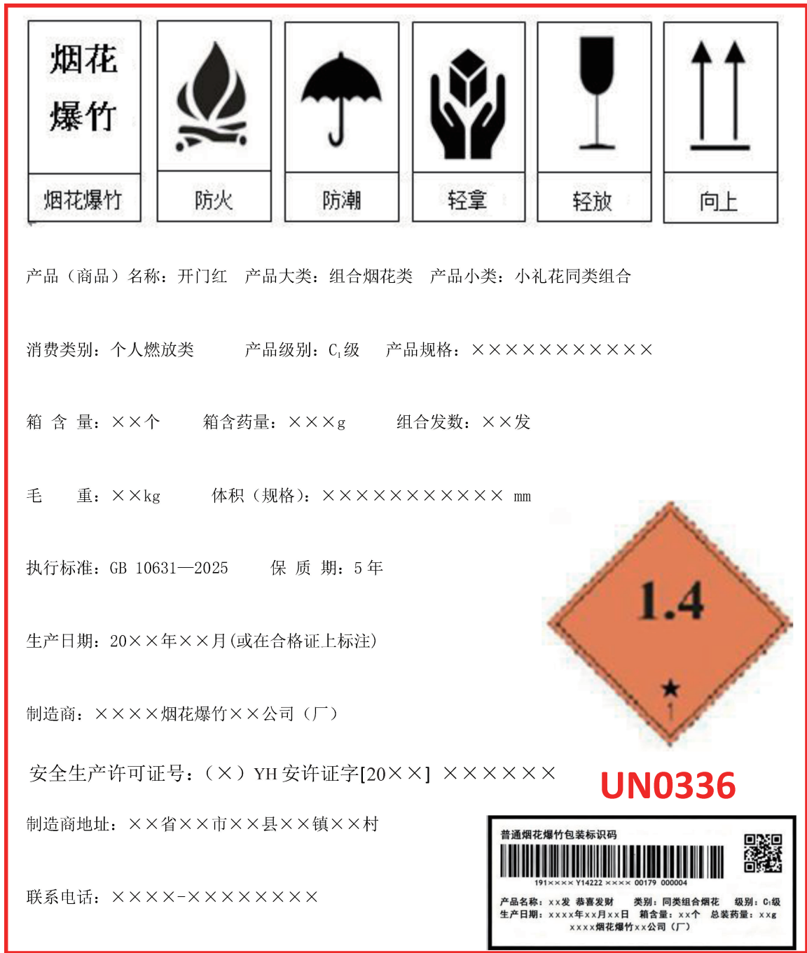
图 B.1 烟花爆竹运输包装标志示例表