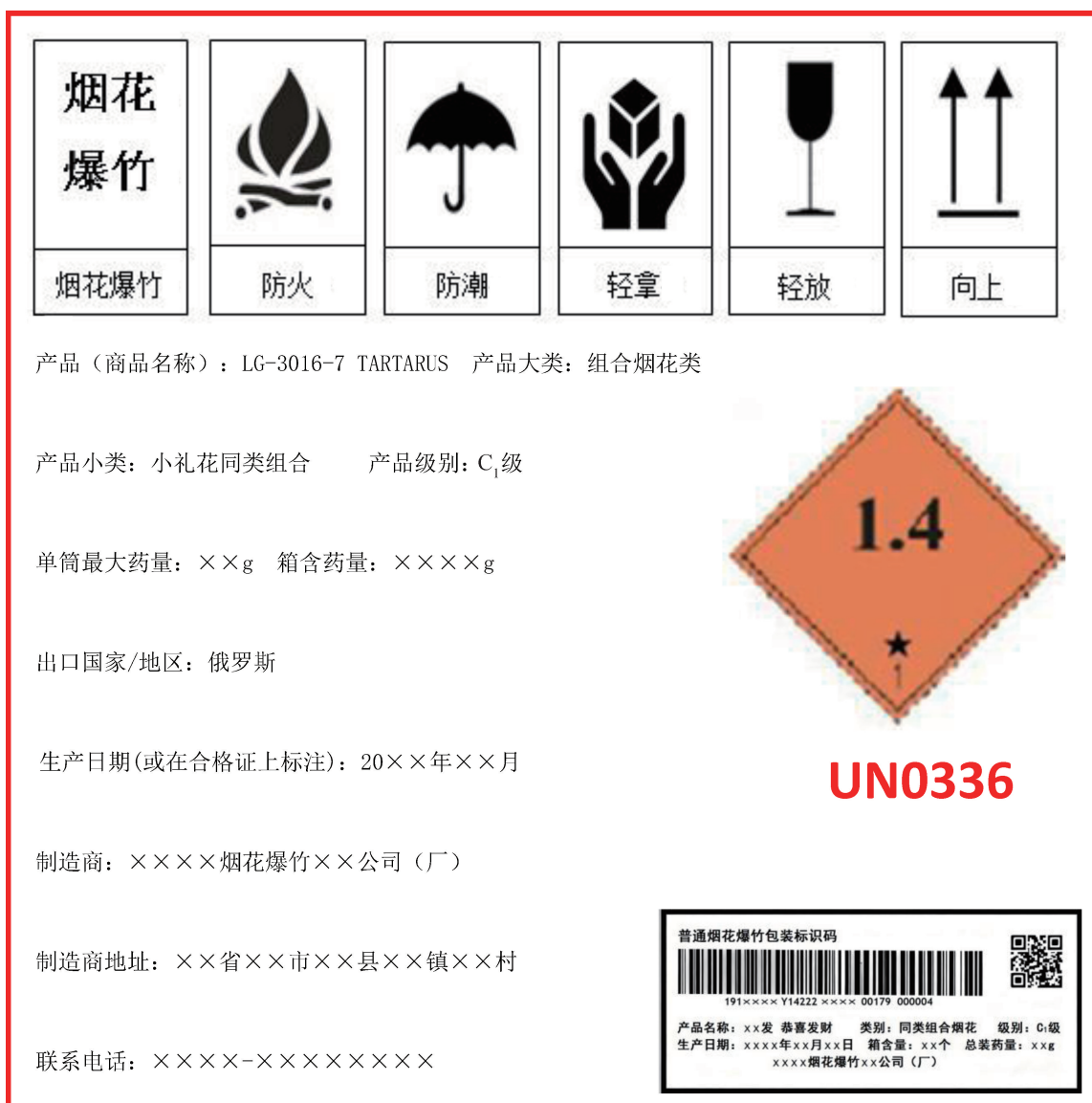
图 B.2 出口产品运输包装标志示例表